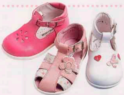
左 ¥14,175、中 ¥13,650 (11.5~14.5cm)、右 (12~17cm) ¥14,700~¥15,750/以上アステール(メリサジャパン)

赤ちゃんにとって、足の成長は重要課題。だからこそ、靴選びにはこだわりたい。ソールの柔軟性や衝撃の吸収力、足首のフィット感など、すべてを配慮しながらデザインもキュート。そんなフランス生まれのブランド「アステール」が日本にこの春本格上陸。ファーストシューズから始めよう。