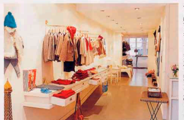
二丁目にディスプレイされたパレロワイヤルのショップ。

Zef ゼフ 32 rue Richelieu 75001 Paris ☎33(0)1・42・60・61・04 営業12時~19時(月) 11時~19時(火~土) 休日、祭、8月は不定休