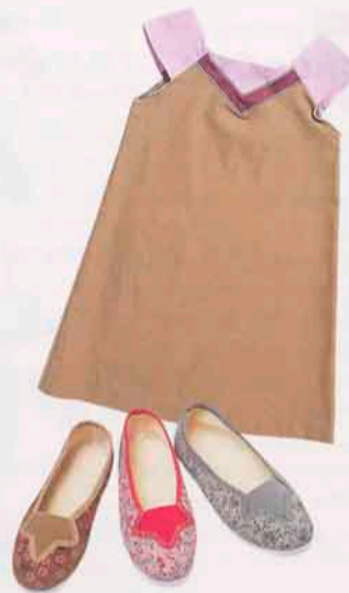
ワンピース55ユーロ、シューズ各25ユーロ。左は小物が並ぶコーナー。2月末には、このパレロワイヤル店に続き、2軒目もオープン予定だという。

Zef ゼフ 32 rue Richelieu 75001 Paris ☎33(0)1・42・60・61・04 営業12時~19時(月) 11時~19時(火~土) 休日、祭、8月は不定休